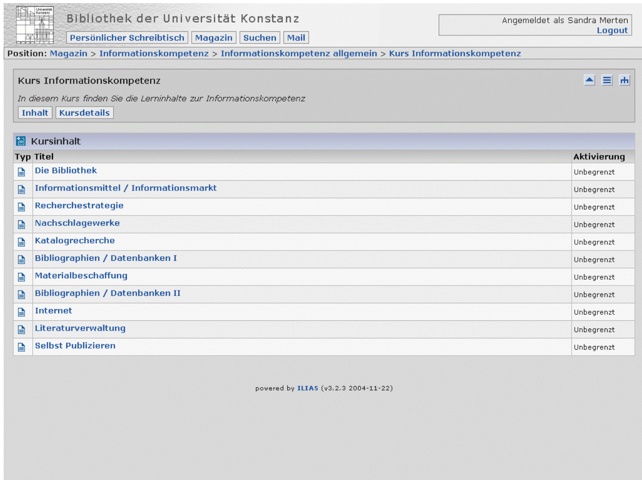
Abbildung 3: Die elf Module der Informationskompetenz in ILIAS

Auf diese Art und Weise können die Kurse der einzelnen Fächer ganz unterschiedlich sein: sie können einzelne Lektionen zu Bereichen der Informationskompetenz, Aufgaben und Tests beinhalten, es können Materialien hinterlegt und Foren angeboten werden.